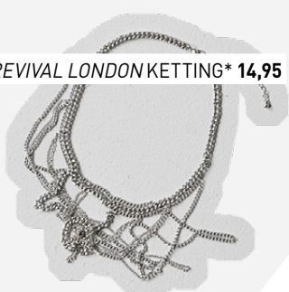
REVIVAL LONDON KETTING* 14,95