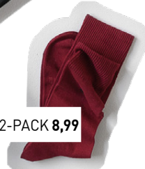
LEVI'S SOKKEN* 2-PACK 8,99