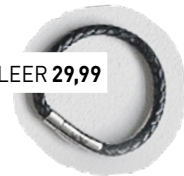
ARMBAND LEER 29,99