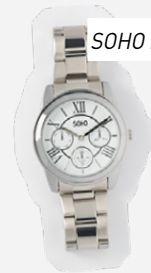
SOHO NEW YORK HORLOGE 39,99