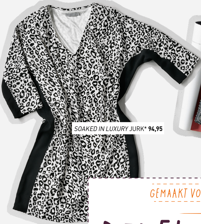
SOAKED IN LUXURY JURK* 94,95