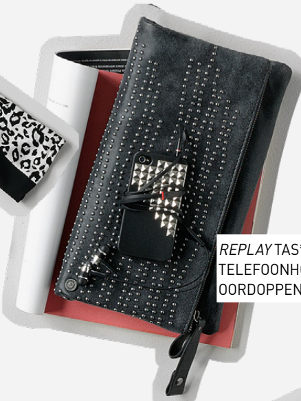
REPLAY TAS* 109,- TELEFOONHOESJE 7,99 OORDOPPEN 9,99