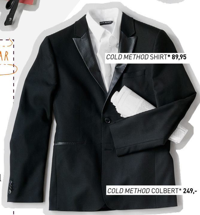
COLD METHOD SHIRT* 89,95

Een tikkie tegendraads: in de Rebel trend draait het om de stoere en verrassende mix van Punk met historische elementen. Denk aan bloemenpatronen die zo uit een Barok schilderij lijken geplukt. Gecombineerd met good old Punk-ingredienten zoals leer en Schotse ruiten, heb je dé actuele look helemaal te pakken!