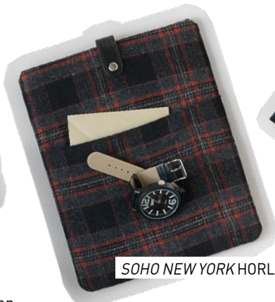
SOHO NEW YORK HORLOGE 39,99