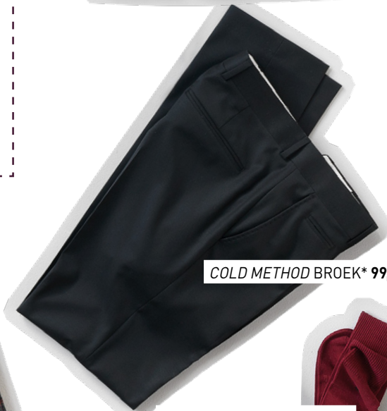
COLD METHOD BROEK* 99,95