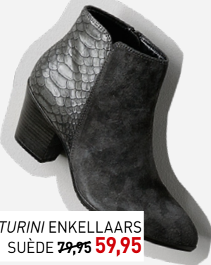
VENTURINI ENKELLAARS SUÈDE 79,95 59,95