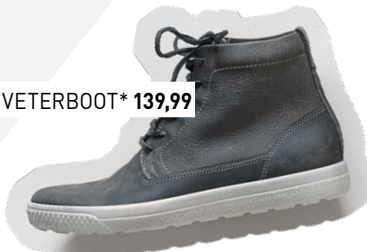
ECCO VETERBOOT* 139,99